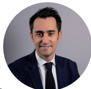
Cédric de OLIVEIRA Maire de Fondettes