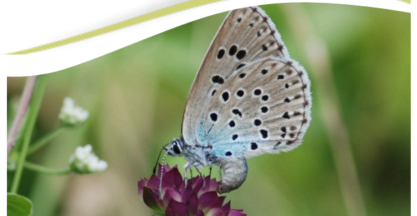
Azuré du Serpolet

Nous vous invitons à prendre part à cette aventure en nous communiquant vos observations lors de vos promenades, car toutes les données comptent !